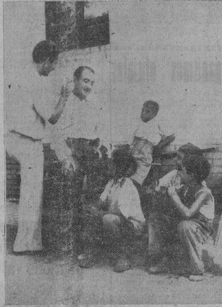
Nueva York. — El actor cinematográfico Clifton Webb, que actualmente se halla rodando en esta capital la película "The Man Who Never Was", admirado por un grupo de niños onubenses mientras es maquillado