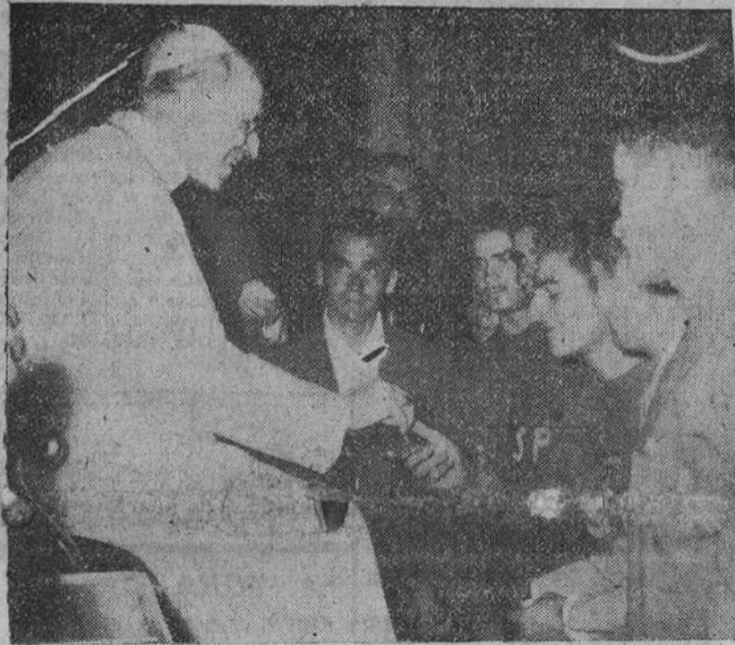
Roma.—Su Santidad el Papa, Pío XII, durante la audiencia concedida a los ciclistas españoles que han participado en el Campeonato del Mundo. En la foto, conversa con los componentes del equipo aficionado. Al fondo, el profesional Botella