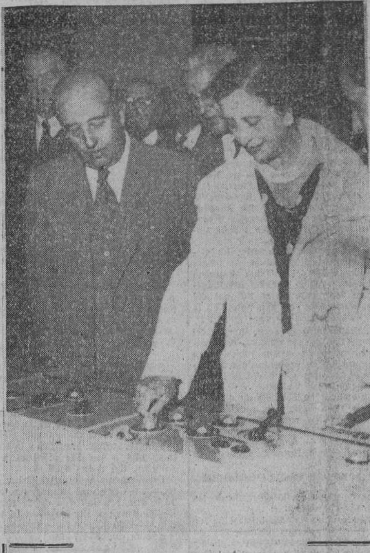
Escalas. — S. E. el Jefe del Estado y las personalidades de su séquito en el momento en que su esposa, doña Carmen Polo de Franco, puso en marcha la central eléctrica de Escalas.