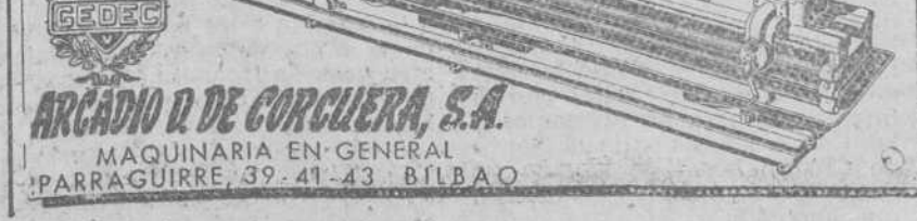
ARCADIO R. DE CORCUERA, S.A. MAQUINARIA EN GENERAL PARRAGUIRRE, 39-41-43 BILBAO