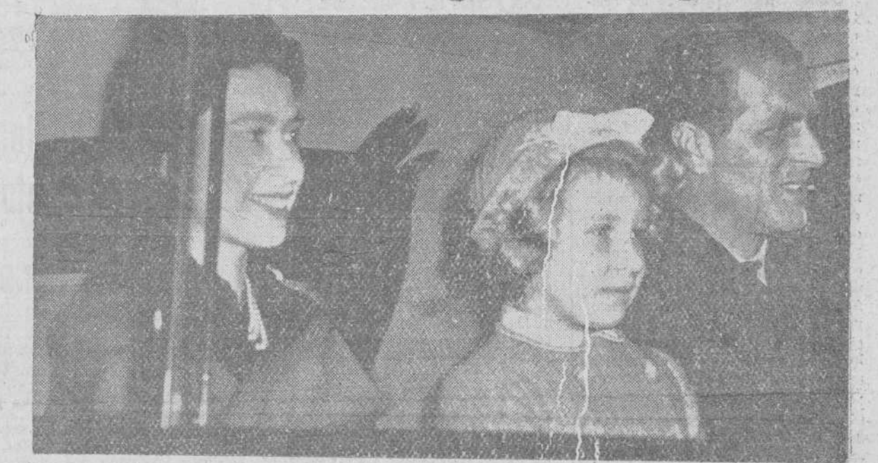
La Reina Isabel II y el Príncipe Felipe, dirigiéndose al Palacio de Buckingham, a su regreso del viaje realizado a los Estados Unidos. Les acompaña en el coche la Princesa Margarita no pudo estar presente en el aeropuerto, a causa de un compromiso oficial y el Príncipe Carlos tampoco asistió, por estar en la escuela.