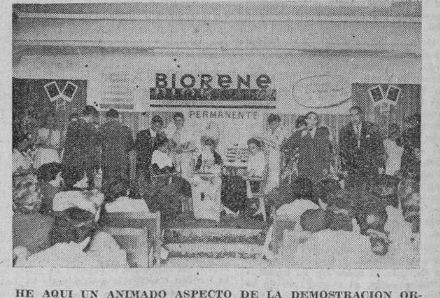
HE AQUÍ UN ANIMADO ASPECTO DE LA DEMOSTRACION ORGANIZADA POR CASA "EUGENE, S. A.". EL GRABADO REPRODUCE UNA DE LAS FASES DE LA EXHIBICION QUE CAUSO GRATIA IMPRESION EN LOS PELUQUEROS FEMENINOS DE BURGOS.

Estuvo organizada por "EUGENE, S. A.", en honor del gremio de peluqueros de señoras