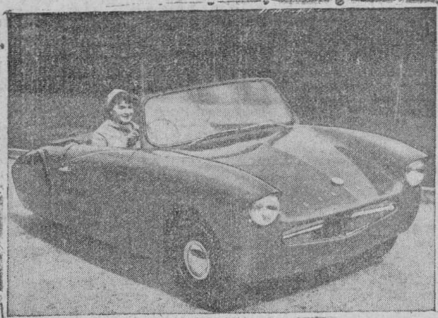
LINEAS MODERNAS, ESTABILIDAD Y LUJO EN EL NUEVO "CORONET"

Su carrocería es de plástico, por lo que el "Coronet" de tres ruedas desarrolla una velocidad excelente, dado su reducido peso. Los costes de mantenimiento son muy pequeños, ya que el carrozado no se oxida y resulta más resistente que el acero. Su velocidad máxima es de noventa y seis kilómetros por hora y no llega a los cuatro litros de consumo de esencia por cien kilómetros a una velocidad de cuarenta y cuatro kilómetros por hora—Argos.