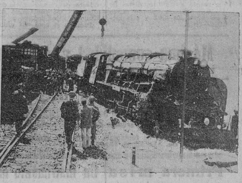
Aspecto que ofrecía la máquina del rapidillo después del accidente de Villafria y en el que resultó con graves daños. Obsérvese al fondo la gigantesca grúa entrando en acción para retirar de la vía tan pesada locomotora.

Cuando se disponía a cruzar la vía férrea le sorprendió el tren Talgo que por efecto del viento le arrojó a la casajera del río, siendo tan violento el golpe que