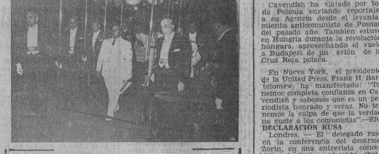
San Sebastián.— Su Excelencia el Jefe del Estado entrando bajo palio en el Templo de Santa María, para asistir a la solemne Salve en honor de la Virgen del Coro, Patrona del pueblo donostiarra. — (Foto Cifra).