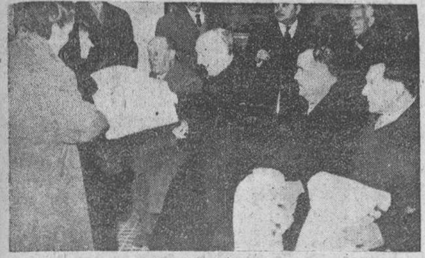
Nuestro redactor gráfico "Fede" obtuvo ayer tarde la presente instantánea durante el acto de distribución de mantas a 500 pobres de la ciudad, entrega que verificaron en el Palacio arzobispal el Prelado de la diócesis y las primeras autoridades que aparecen en el grabado. (Información en 4.ª página.)