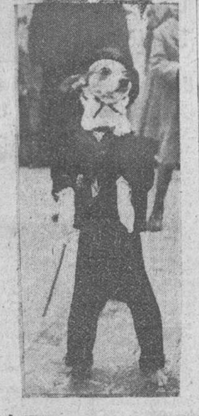
Madrid. — El desfile de animales que todos los años se celebra en la festividad de San Antón, fue pródigo en escenas que causaron el regocijo de los asistentes. He aquí un perrito muy ufano de su traje de etiqueta, paseando solito por el recinto del desfile.