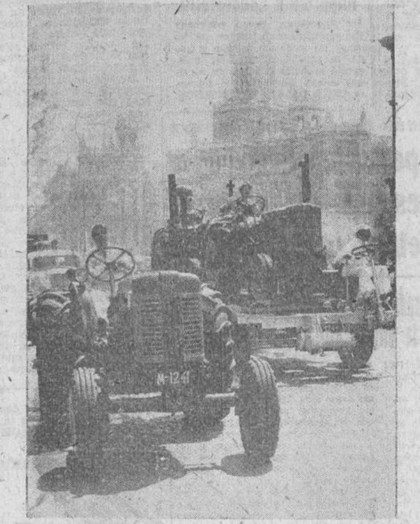
Con motivo de celebrarse el pasado año en Madrid la III Feria Internacional del Campo, una vistosa cabalgata anunciadora de la inauguración del gran certamen desfiló por las calles de la capital de España, desfile del que hoy exhibimos esta fotografía. En ella figuraron multitud de modernos tractores, como muestra de la pujanza que está alcanzando la mecanización del agro español.

año, los pastos y la siembra. Posiblemente una oportuna importación de piensos hubiera evitado la subida que experimentó la cebada y que, el escaso su-