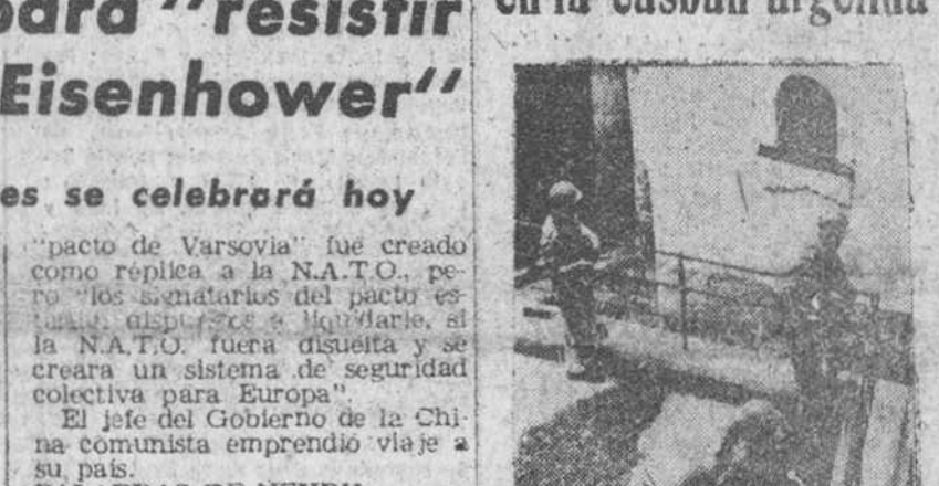
Argel. — Soldados franceses durante las operaciones de control y registro, ordenadas por el general Massu, que ha recibido la responsabilidad del mantenimiento del orden y seguridad en Argel. — (Foto Cifra)