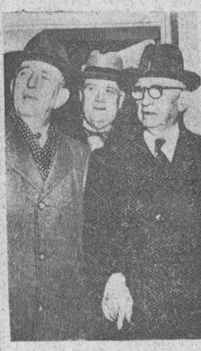
Washington.—Los senadores Richard B. Russell, Alexander Wiley y Walter F. George de (izquierda a derecha) a la salida de la Casa Blanca, después de una conferencia de cuatro horas de duración con el presidente Eisenhower, el cual informó sobre su propósito de someter a la consideración del Congreso norteamericano, una resolución declarando el firme propósito de América de oponerse a cualquier intervención futura de Rusia en Oriente Medio.