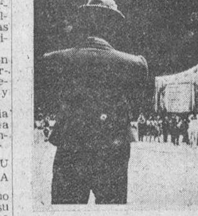
Barcelona.—Un aspecto de la pista del palacio municipal de Deportes, durante la entrega de premios del Festival Mundial de Circo 1956.