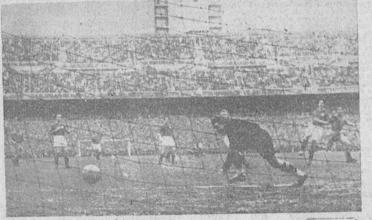
El primer gol español, logrado por Suárez, en el encuentro internacional de fútbol España-Suiza, jugado el pasado domingo en el estadio Santiago Bernabeu, de Madrid