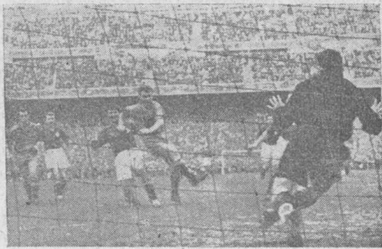
En los últimos minutos del encuentro, Kubala se encuentra ante el portero suizo, disparando fuerte, pero Parlier, bien colocado, neutralizó el tiro.