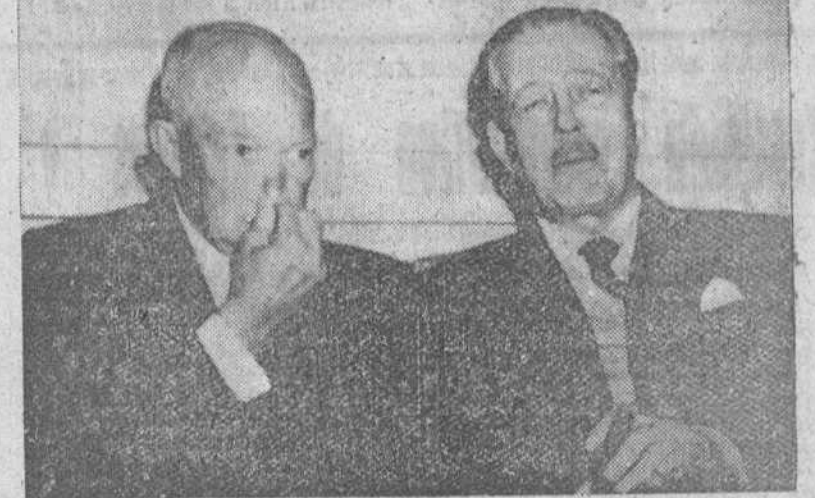
Bermudas. — Uno de los reporteros gráficos que asistió a la entrevista Eisenhower - Mac Millan, consiguió dos placas con la misma pose en ambas personalidades. Una curiosa coincidencia, que ofrecemos a nuestros lectores.