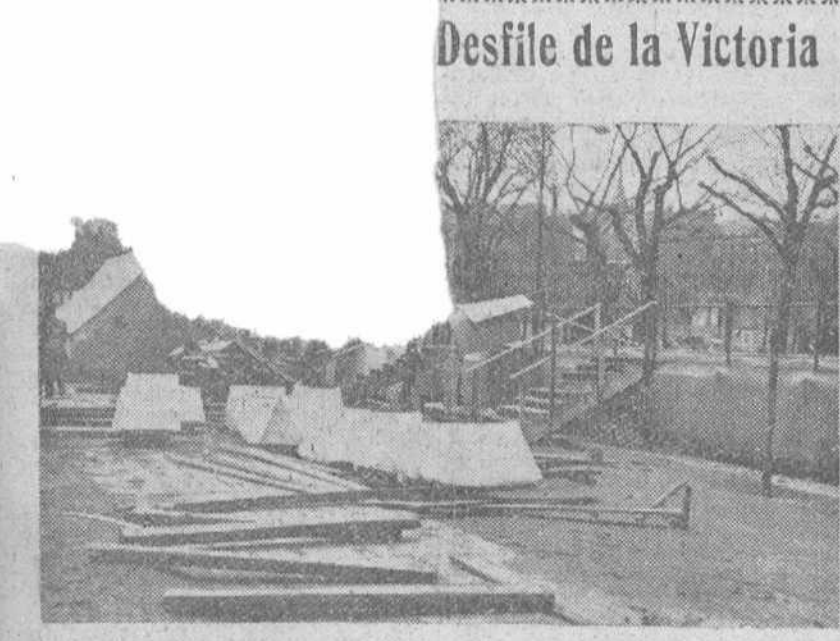
Desfile de la Victoria

Misiones de las Guardias Republicana y Fiscal portuguesas visitan a la Guardia Civil