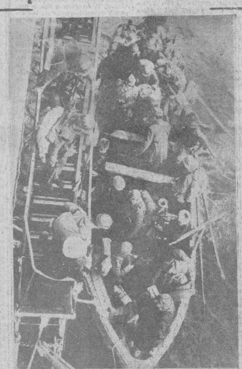
Sidi Ifni. — Uno de los contingentes de tropas españolas enviadas a Sidi Ifni, desembarcando del crucero «Canarias» en un «carabo», para llegar a tierra en las playas de Sidi Ifni.