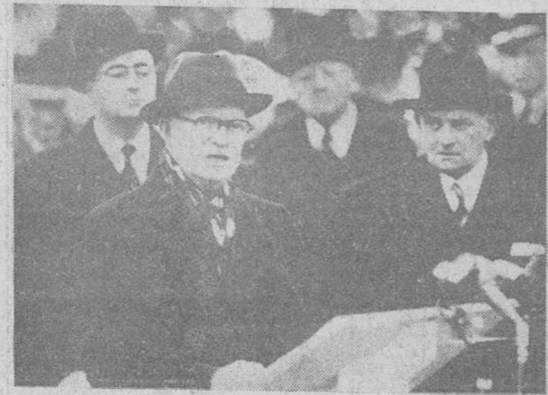
Paris. — A su llegada al aeropuerto de Orly, el presidente Eisenhower —entre el primer ministro francés Félix Gaillard y el presidente Coty— pronuncia unas palabras por los micrófonos.

"Nombre Ejército y mi propio, recibían sentidísimo pésame heroica muerte su esposo sargento Torres Vives caído gloriosamente al frente de sus hombres defensa sagrados intereses Patria. Su muerte servirá de estímulo perdurable en Ejército y será estimulo (Pasa a cuarta página).