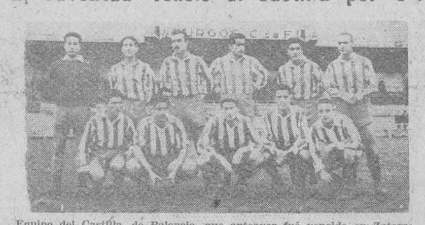
Equipo del Castilla, de Palencia, que anteayer fué vencido en Zatorre, por el Juventud (3-1).

Por 3-1 ganó el Juventud al Castilla, de Palencia. Resultado lógico y normal, de un partido sin ningún relieve especial, con una primera parte ligeramente entretenida y una segunda soporífera. De que esto fuera así, hay que atribuirlo a dos causas principales: la primera, el mal estado del terreno, embarradísimo, lo que hizo media en la potencia física de los equipos y la segunda, la lesión de Casiano — a raíz de obtenerse el tercer gol — y que desarticuló la delantera local.