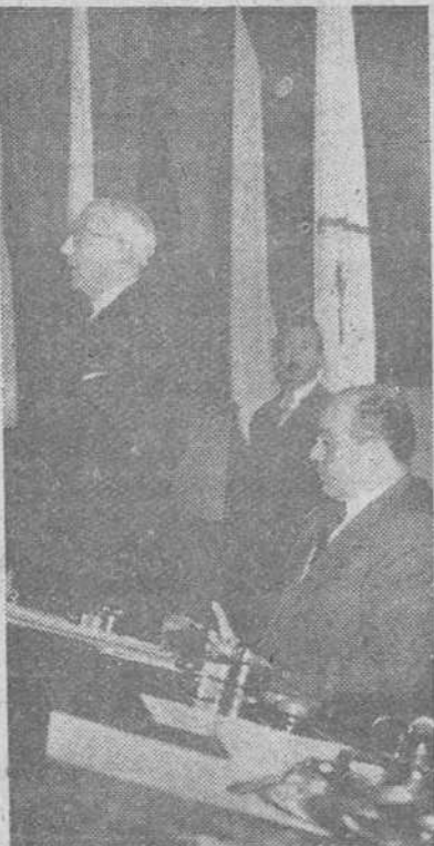
Madrid. — El ministro de Industria, señor Planell, durante su discurso en el Consejo Económico Sindical presidido y clausurado por el ministro secretario general del Movimiento, señor Solís.

en metálico a los obreros del puerto, así como la inauguración de la Residencia sanatorial "20 de Noviembre" del Seguro de Enfermedad, y ha visitado la ciudad deportiva "Francisco Franco", el grupo de mil viviendas que constituye el Patronato provincial de la Vivienda, en las proximidades de esta ciudad, y el edificio de la C. N. S. alicantina, donde tuvo un amplio cambio de impresiones.