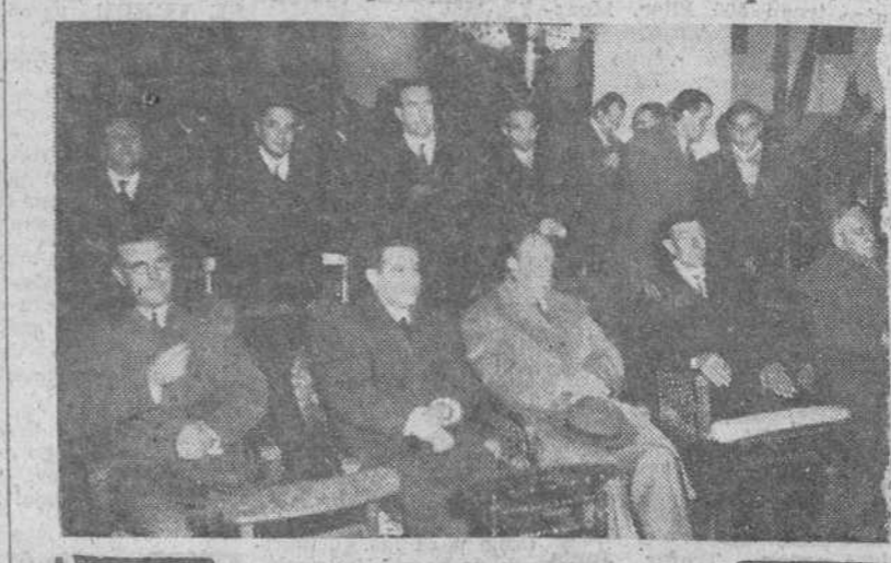
El domingo se celebraron en Torrepadre brillantísimos actos, con motivo de la entrega de títulos de propietarios a 41 colonos de dicho pueblo. En nuestra foto, la presidencia del acto religioso que precedió a la entrega de dichos títulos