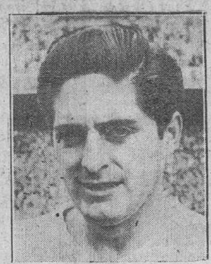
Héctor Rial y Raymond Kopa, los dos jugadores del Real Madrid, autores de los goles obtenidos por su equipo frente al Manchester.

EN QUINTA PAGINA AMPLIA INFORMACION Y COMENTARIOS DE ESTE GRAN TRIUNFO OBTENIDO POR EL FUTBOL ESPAÑOL