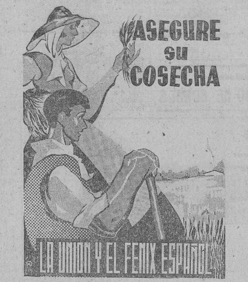
Oficinas en Burgos: VITORIA, 9, 1.

Vitoria. — Pocas transacciones en el mercado, en el cual, a excepción de las crías de porcino, en las que hubo una ligera baja en los precios, por lo demás, persiste la tendencia al alza. Nuevamente la ha tenido el cebón, así como también el cebado de porcino. Los corderos, con motivo de la Pascua, igualmente subieron de precio. Las cotizaciones fueron: Las crías de dos meses, de 350 a 550 pesetas cada una; los primales, de 800 a 1.400; los de engorde, de 1.250 a 2.400; el cebado de 21,50 a 22,50 kilo en vivo. La pareja de buques, de 19.000 a 27.000 pesetas. La de novillos experimentó ligera alza, oscilando entre 15.000 y 18.000 pesetas. El cebón entre 32 y 35 pesetas kilo, en canal; la ternera, de 41 a 48 pesetas; el equino, de 8 a 13 pesetas kilo, el adulto. El lechón también subió de precio, estando de 14 a 19 pesetas kilo, en canal. Corderos, de 23,50 a 25 pesetas kilo, en vivo.