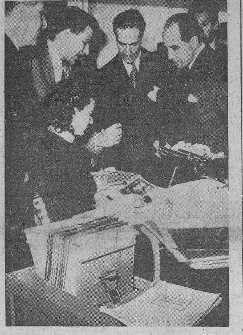
Milán.—El ministro español de Comercio, Sr. Ullastres, acompañado del presidente de la Feria, del embajador español en Roma y otras personalidades, durante su visita al recinto ferial, con motivo de su asistencia a los actos organizados con la celebración del “Día de España” en dicho certamen.

1. Crear una atmósfera favorable para las vocaciones misioneras en todas las escuelas católicas, parroquias, Acción Católica y organizaciones benéficas. 2. Los Prelados no deben tener miedo a ayudar en el incremento del número de misioneros, a pesar de la escasez de sacerdotes que se registra en muchas diócesis. 3. Los Prelados deben discutir conjuntamente los problemas relacionados con esta cuestión y encontrar soluciones comunes en el campo misionero, que constituye uno de los deberes de la Iglesia y de cada uno de sus miembros. 4. Los Prelados deben mantenerse en contacto con el director de Misiones pontificias y los superiores de las Congregaciones misioneras, para ayudar en la tarea de conseguir misioneros. 5. Es particularmente necesario dar ayuda espiritual a los jóvenes africanos y asiáticos que son obligados, por razones de estudio, a vivir lejos de sus países natales.