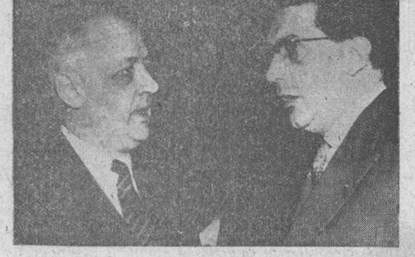
Nueva York. — El ministro francés de Asuntos Exteriores, M. Pineau, conversa con el ex-gobernador de Argelia, M. Jacques Soustelle, a la derecha, momentos antes del debate habido en la Asamblea General de las Naciones Unidas sobre el problema argelino.