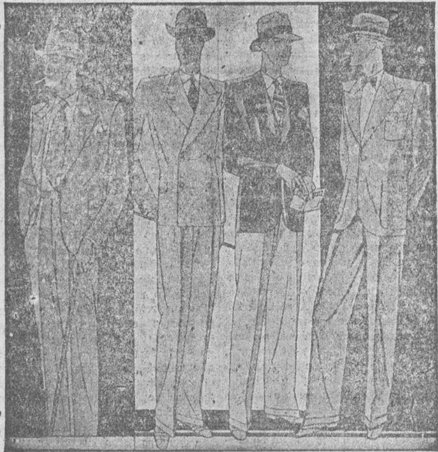
Trajes de confección fina dibujo novedad, desde 50 a 150 pesetas.

Establecimiento oficial del Turing Club Español