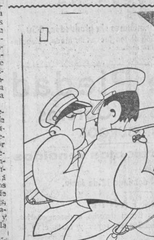
YA SALIO EL PEINE —Hoy hemos recogido diez perros grandes y seis perros chicos. —Así no me extraña que falte la calderilla.