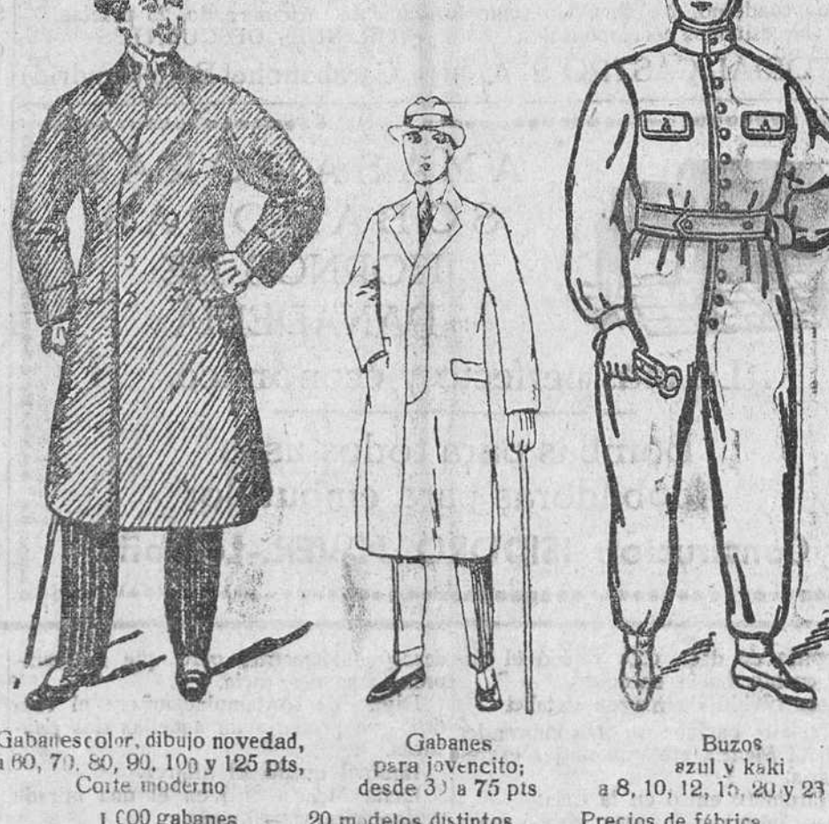
Gabanes color, dibujo novedad, a 60, 70, 80, 90, 100 y 125 pts. Corte moderno. 100 gabanes - 20 modelos distintos Buzos azul y kaki a 8, 10, 12, 16, 20 y 23 pt. Precios de fábrica