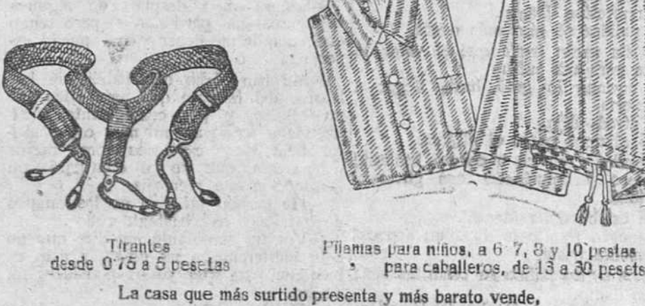
Tirantes desde 0,75 a 5 pesetas Flecos para niños, a 6, 7, 8 y 10 pesetas para caballeros, de 13 a 30 pesetas