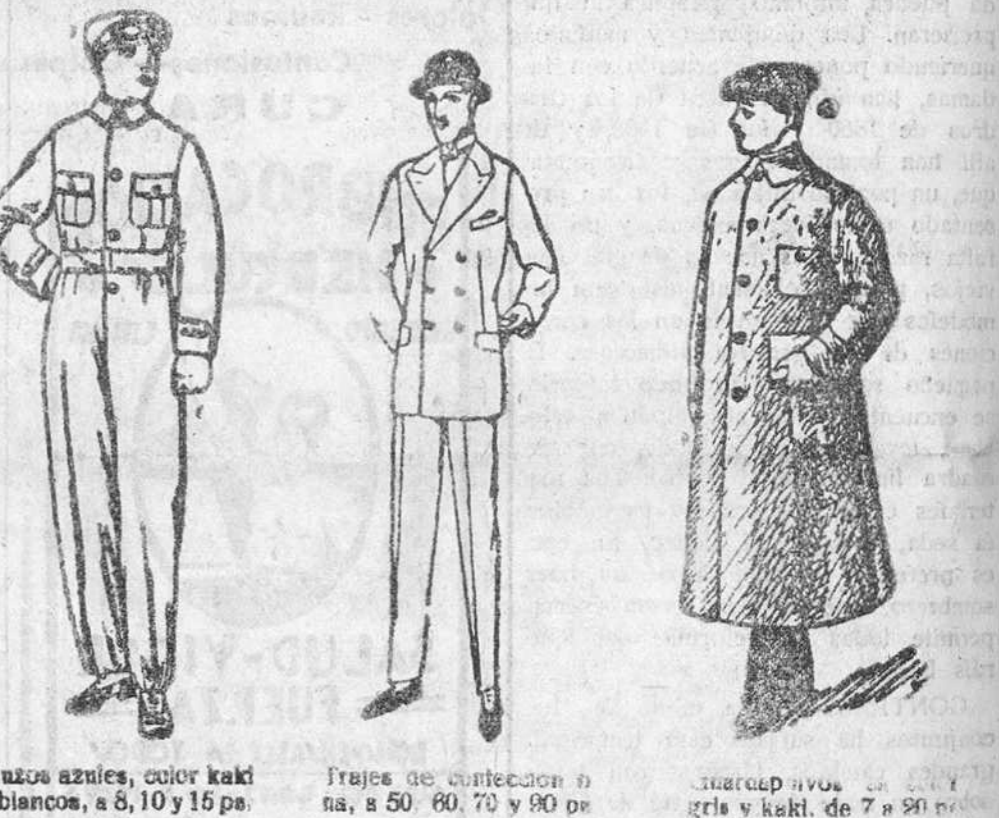
Suavos azules, color kaki y blancos, a 8, 10 y 15 ps. Trajes de confección fina, a 50, 60, 70 y 90 ps. Confección nueva de niñas y niños, a 7 y 80 ps.

Gran casa de tejidos y ropas confeccionadas para caballero, señora, jóvenes y niños SASTRERIA Y PAÑERIA TELEFONO 603 R Establecimiento oficial del Turing Club Español