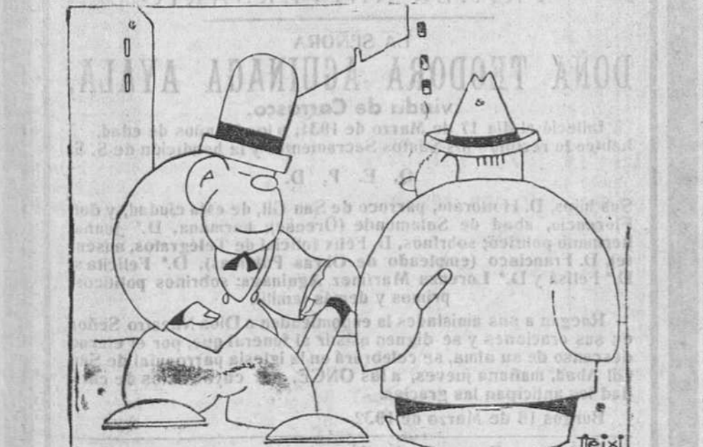
—Bonito sombrero. ¿Cuánto te ha costado? —Diez pesetas del afa. —¡Barato! —Y quince de la copa.