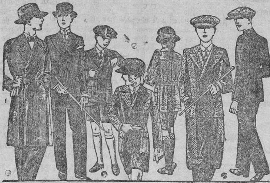
Trajes para jovencitos, edad de 12 a 20 años, a 40, 50, 60, 70 y 80 ptas.

Primera casa en confecciones para caballero, señora y niños Plaza Mayor, 42. Lain-Calvo, 9 y 11.-Suursal: Plaza Mayor, 6, Burgos