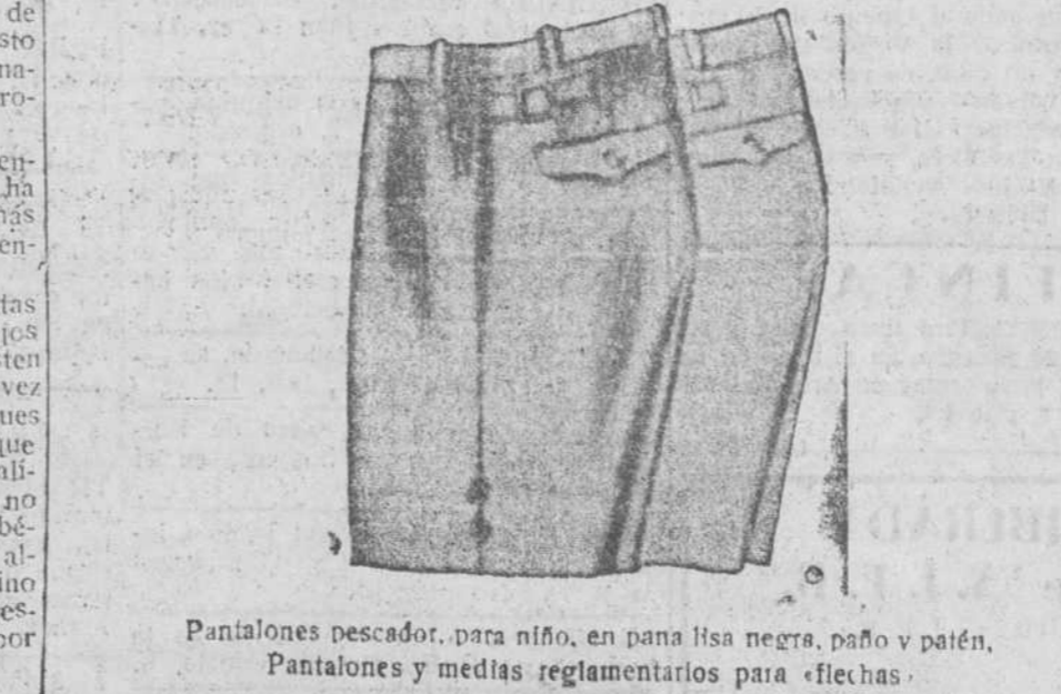
Pantalones pescador, para niño, en pana lisa negra, paño y patén. Pantalones y medias reglamentarios para flechas.

Pr.mera casa en tejidos y confecciones para caballero, señora, jóvenes y niños PAÑERIAS - SASTREIAS - CALZADOS SEGARRA