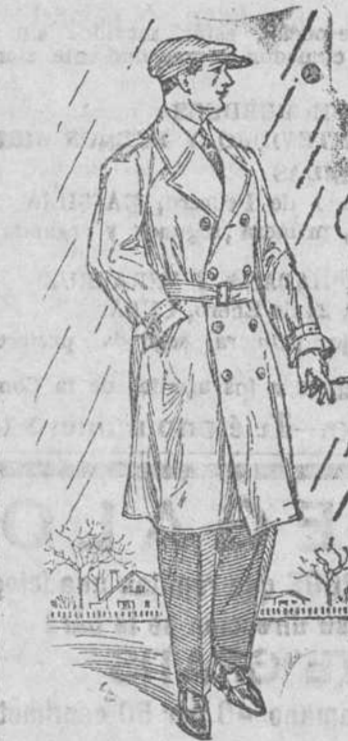
TRINCHERAS DE CALIDAD SUPERIOR tela engomada y botón cuero, desde 35 pesetas.

antes de comprar, ver la colección que de TRINCHERAS, PELLIZAS, ABRIGOS DE PAÑO Y CUERO y trajes de todas clases para caballero y niño presenta esta Casa