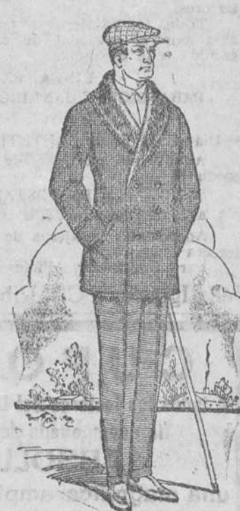
PELLIZAS gran surtido, desde 28 a 125 pesetas.

Gran surtido en bufandas, mantas de cama y géneros de punto a precios sumamente baratos