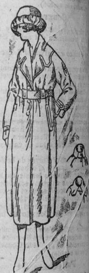
Gracilinas señora, desde 110 á 140 pts.