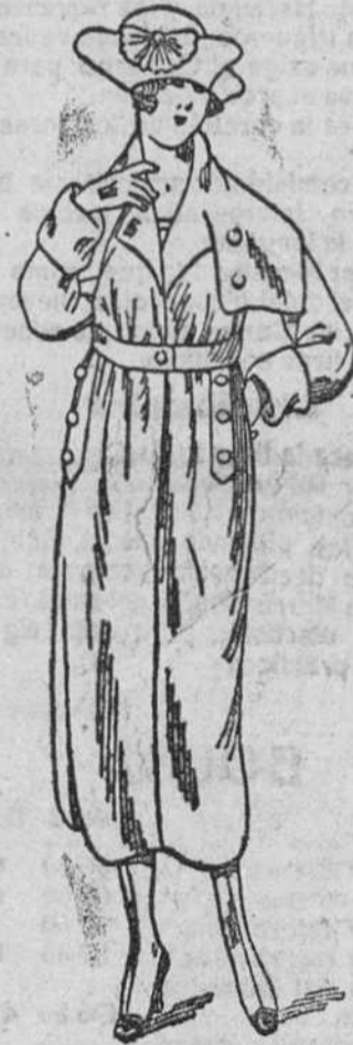
Abrigos novedad, en gamuzas, desde 35 á 130 pts.

Primera casa en confecciones de caballero, señora, niños y niñas