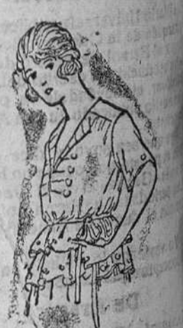
Jerseys lana, en colores novedad, á 15, 18, 20 y 25 pts.