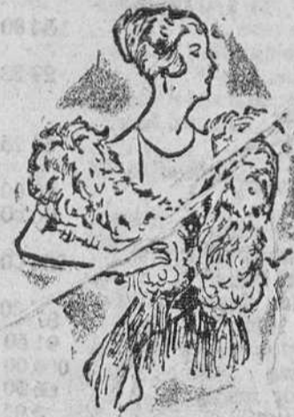
Cuellos de pluma «Saldo» desde 25 á 65 pts.