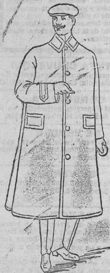
Impermeables inglesas y alemanas á 45, 50, 60, 70, 80, 90, 110, 120 y 125 pesetas.

Primera casa en confecciones de caballero, señora, niños y niñas