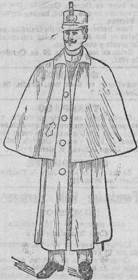
Impermeables militares, con esclavín, á 120, 130, 140, y 150 pesetas; sin esclavín, á 75, 80, 90 y 100 pesetas.