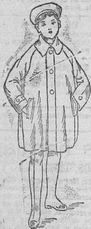
Abrigos impermeables para niños, desde 25 á 50 pesetas.