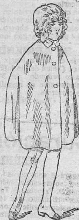
Abrigos impermeables para niñas, desde 9 á 25 pesetas.