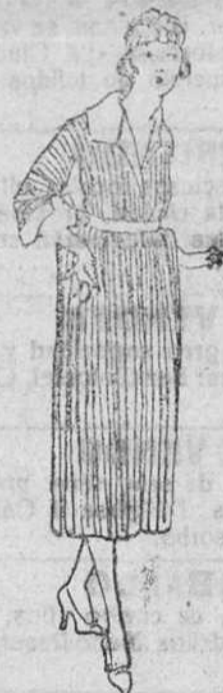
Vestido entero de lana, en azul, negro y colores, de 35 á 100 pts.

Primero casa en confecciones de caballero, señora, niños y niñas