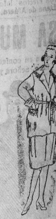
Trajes de levita para jóvenes, en lana, azul, negro y colores, desde 35 á 50 pesetas.