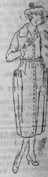
Trajes enteros, en algodón, colorido y listado, de 18 á 40 pts.