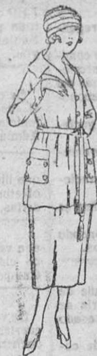
Trajes de levita, en negro, azul y colores, desde 50 á 120 pts.