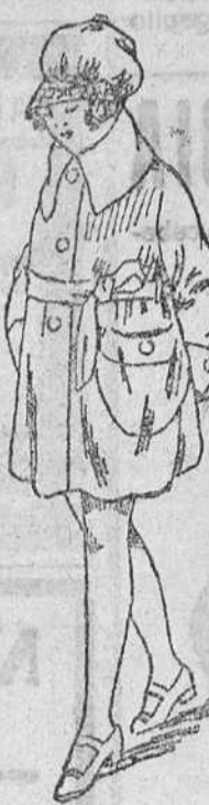
Abrigos paño gomezas formas y colores novedad, para niñas de 4 á 8 años, á 10, 15, 18 y 20 pts. Id. de nueve á quince, á 22, 24, 28 y 30 pts.