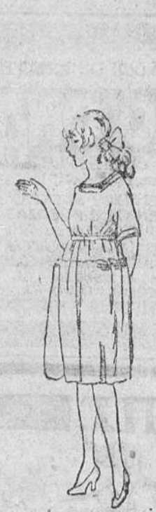
Vestiditos niñas de tres á siete años, en lanas colores novedad, á 10, 12, 15, 18 y 20 pesetas.