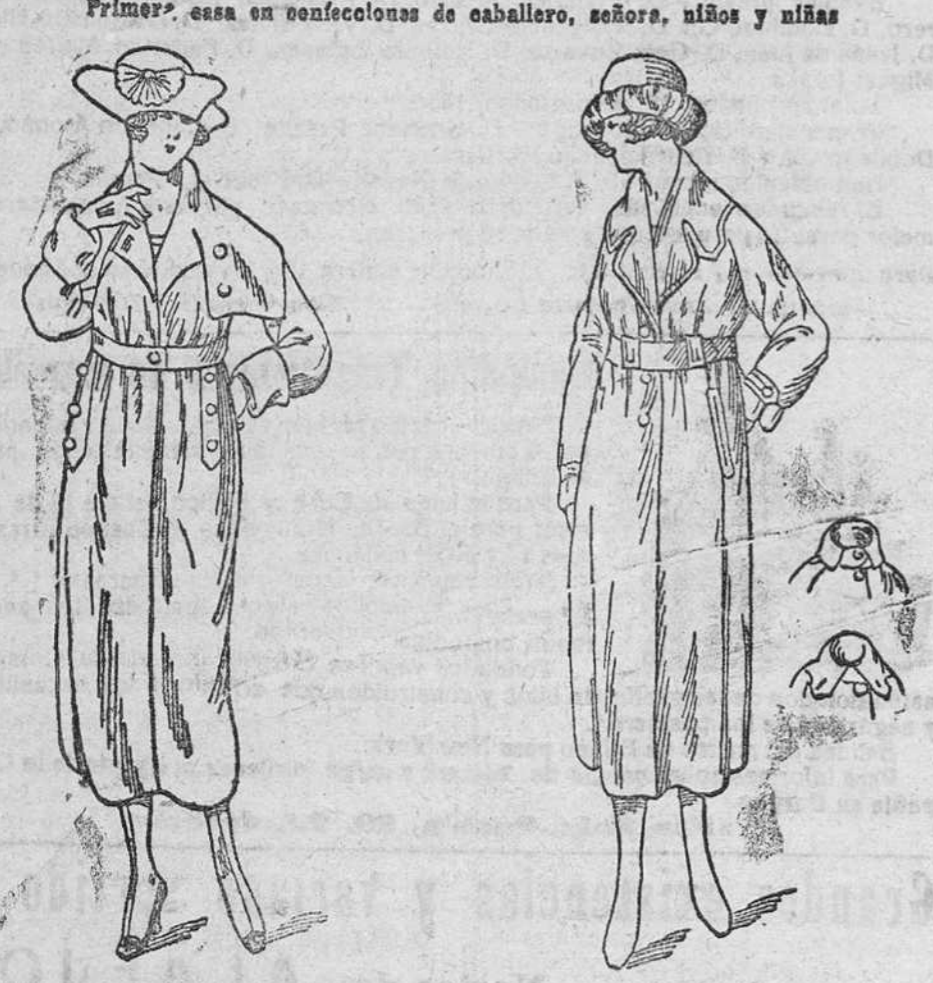
Abrigos novedad, en gamuzas, desde 35 á 150 pts. Gabardines señora, desde 100 á 140 pts.

CASA MUNGUÍA. (Sucesor de Rebollo) Plaza Mayor, 42 y Lain-Calvo, 9.-Teléfono núm. 88.-Burgos