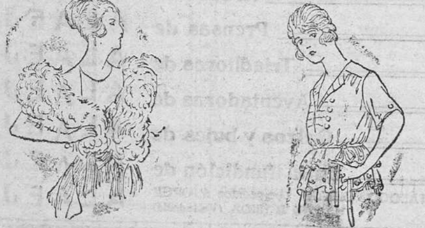
Cuellos de pluma «Saldo» desde 25 á 65 pts. Cerseys lana, en colores novedad, á 15, 18, 20 y 25 pts.