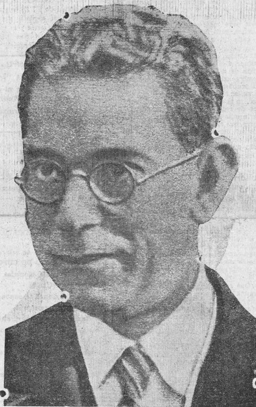
El general D. Emilio Mola, jefe del Ejército del Norte y miembro de la Junta de Defensa Nacional