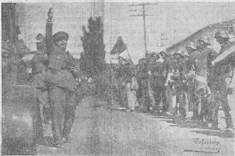
El coronel García Escámez arengando a sus tropas

Respecto al frente del sur, según las noticias circuladas, se está combatiendo en la orilla derecha del Tago. Y no decimos más.