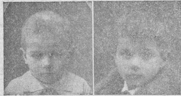
Calvo nacimiento 6 meses curado