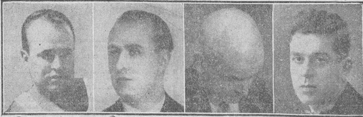
14 años calvo De nueve a una mañana y de dos a ocho tarde, visitará, gratuitamente y a domicilio, avisando previamente a dicho HOTEL, Instituto J. Mourade, Barcelona, Rambla de las Flores, 4, 1.ª. En Madrid, Paucarral, 15.

El inventor del CAPILAR J. MOURADE, universalmente conocido por sus maravillosas curas (muy conocido en España por haber curado una infinidad de casos rebeldes de calvicie), estará el JUEVES, VIERNES y SABADO en esta ciudad, en el HOTEL PARIS, donde recibirá las consultas de los interesados en su maravilloso específico, exponiendo los casos curados, después de 30 años de calvicie.