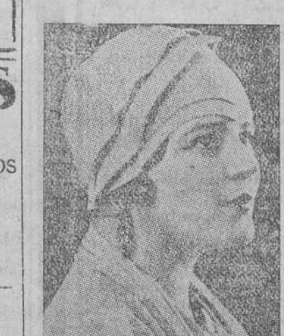
Portrait of a woman, likely related to the theatrical advertisement.

SAL VICHY-ÉTAT producto natural que la hace agradable al paladar y una excelente bebida para régimen y para la mesa. Facilita la digestión y evita las infecciones. Insustituible contra el artritis, reuma, diabetes, gota, etc.