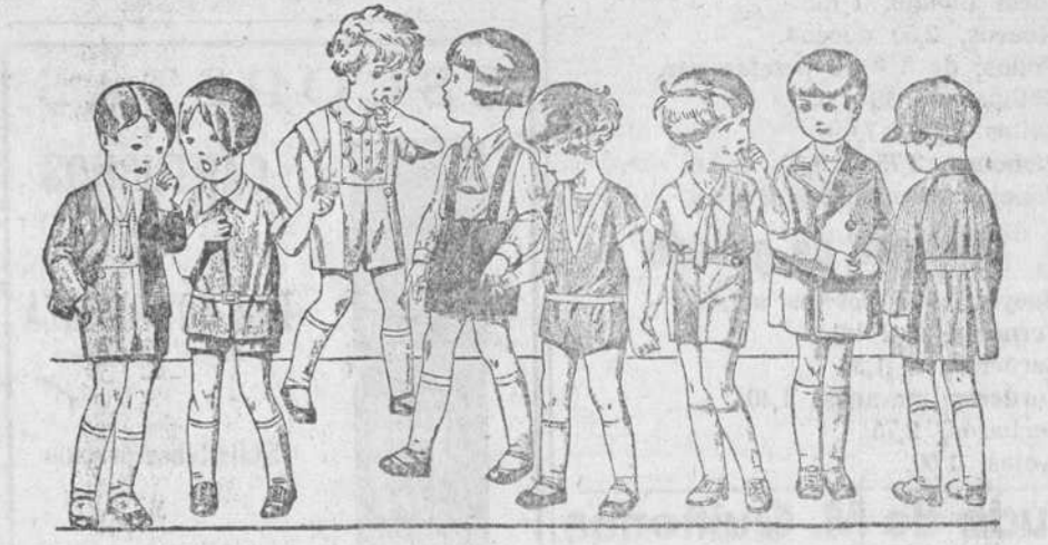
20 diferentes modelos de peleles y trajecitos para niños de 2 a 5 años, en terciopelo, dril, lana y otomán, a 3'50, 4, 5, 6, 8 y 10 pesetas.