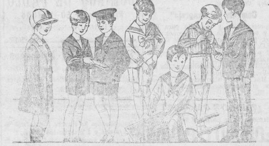
50 modelos distintos en trajecitos para niños, en jergas azules, vicuñas, pañetes y de dril en blanco y color, desde 8 a 35 pesetas. La casa que más surtido presenta y más barato vende.