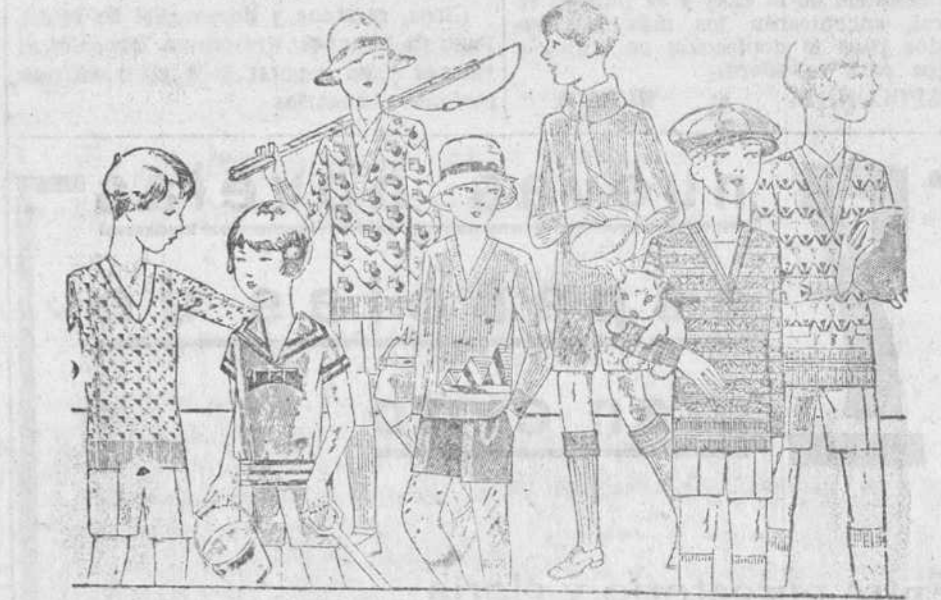
Jerseys y pullover novedad, en lana y algodón, de 4 a 10 pesetas. Modelos y colores novedad. Pantaloncitos cortos de paño, pana, dril y terciopelo.