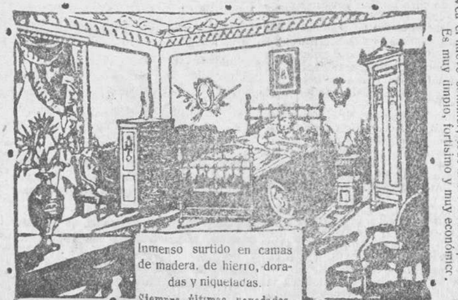
Imenso surtido en camas de madera, de hierro, doradas y niqueladas. Siempre últimas novedades.