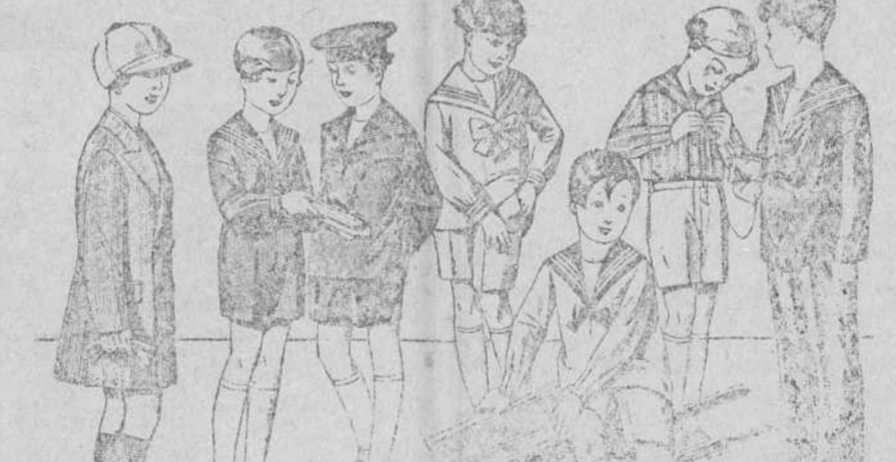
50 modelos distintos en trajecitos para niños, en jergas azules, vicuñas, pafletes y de dril en blanco y color, desde 8 a 35 pesetas.