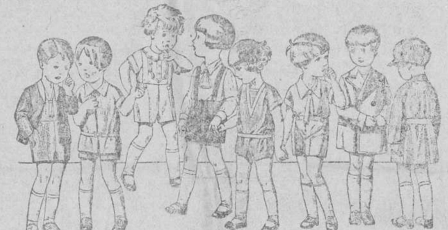
20 diferentes modelos de peleles y trajecitos para niños de 2 a 5 años, en terciopelo, dril, lana y otomán, a 3'50, 4, 5, 6, 8 y 10 pesetas.