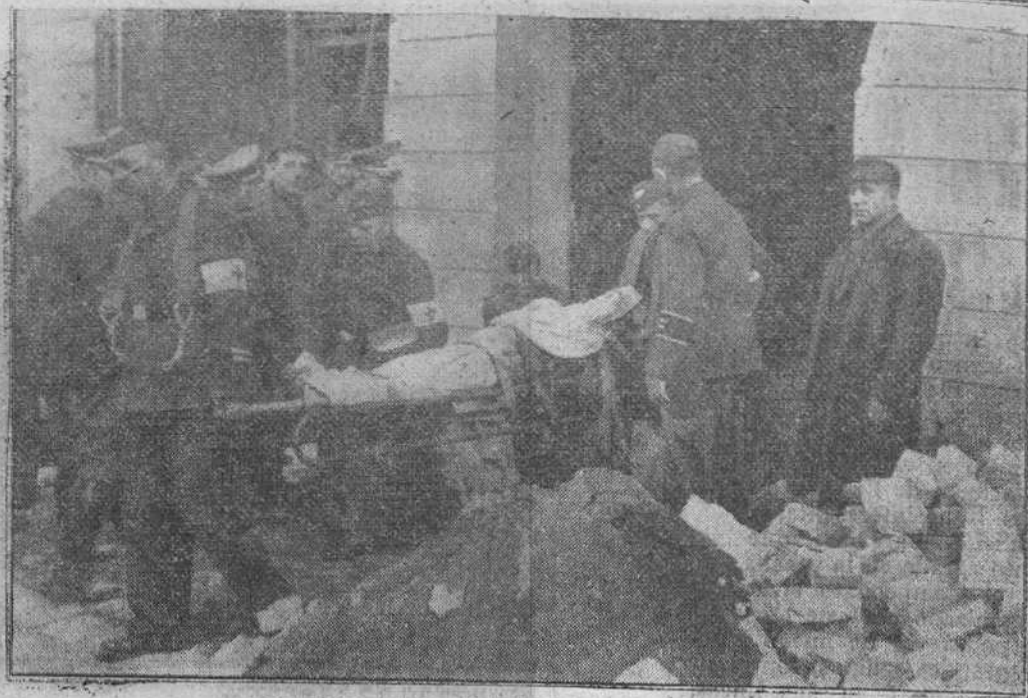
VICTIMAS DE LA POBLACION CIVIL ALEMANA En la noche del 24 de Septiembre, los aviones ingleses pudieron llegar hasta Berlín. Sus bombas, lanzadas al azar y sin precisarias sobre objetivos militares, causaron daños en el Norte y Este de la ciudad, en barriadas muy habitadas. He aquí el momento de retirar una víctima los servicios de Seguridad

MADRID.— El «Boletín Oficial del Estado» publica un decreto por el que cesa en el cargo de subsecretario de Prensa y Propaganda, don José María Alfaro y Polanco, agradeciéndosele el servicio prestado.—Cifra.