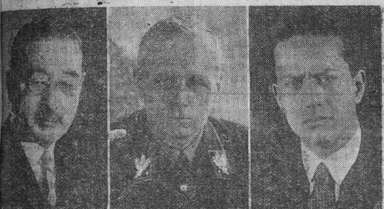
Kurusu, Von Ribbentrop y el Conde Ciano, los plenipotenciarios del Japón, Alemania e Italia, firmantes del Pacto Tripartito de estas tres potencias

El 24 de Agosto de 1939 las democracias occidentales perdieron la batalla frente a Alemania. En la batalla realizada en Moscú por labor realizada en Moscú por Papan, y en la actuación del Sirovy — el militar de Bohemia y Moravia —, hay que buscar las causas de aquel éxito dramático que marca un cambio radical en la conducta de Alemania olvidada hasta ahora desde tiempos de Bismarck. Todo lo que ha sucedido después de la firma del pacto germano-ruso, no es más que simple consecuencia de un paso cuyo alcance muy pronto fueron capaces de apreciar. Si Francia e Inglaterra hubieran tenido dirigentes y no políticos, hubieran establecido la diferencia entre un dirigente, guía, Führer y un político — no hubieran dado nunca a la guerra con Alemania. Esta misma conclusión hacen hoy los que sobreviven a la marejada que tantos políticos ha barrido ya desde la guerra. Se necesita ser bastante obtuso para no esperar que lo que hoy en Europa su eje directriz, se tendiera hacia el Asia con una