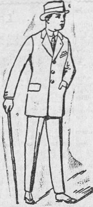
Trajes para caballero, ECONÓMICOS a 35, 40, 45 y 50 pesetas