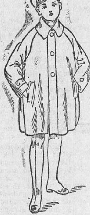
Trincheras y abrigo, a 30, 35, 40, y 50 pesetas.

Precio fijo verdad. Todos los artículos marcados.