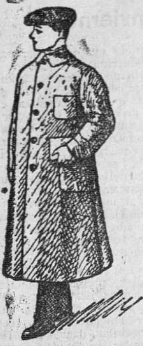
Guardapolvos en color gris y kaki, a 8, 10, 12, 15 y 20 pesetas

Gran casa de tejidos, pañería y confecciones de caballero, señora y niños