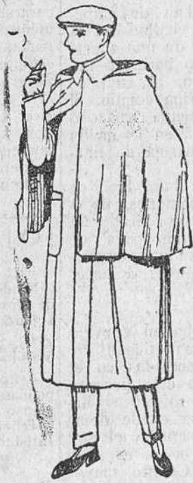
Impermeables, en negro y azul, a 100, 110, 120 y 130 pesetas.