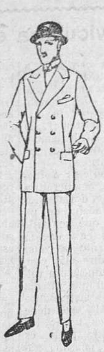
Trajes de paño, corte inglés, a 80, 90, 100 y 120 pts.