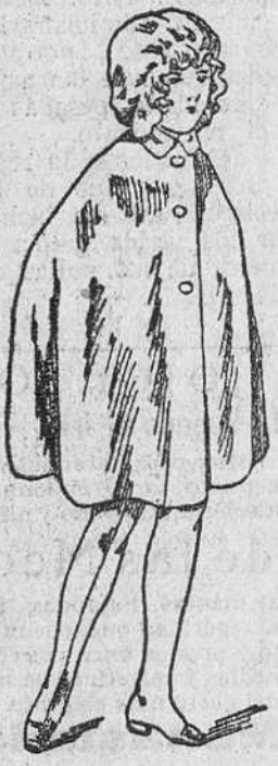
Capitas impermeables, de 8 a 20 pesetas, en negro y colores.