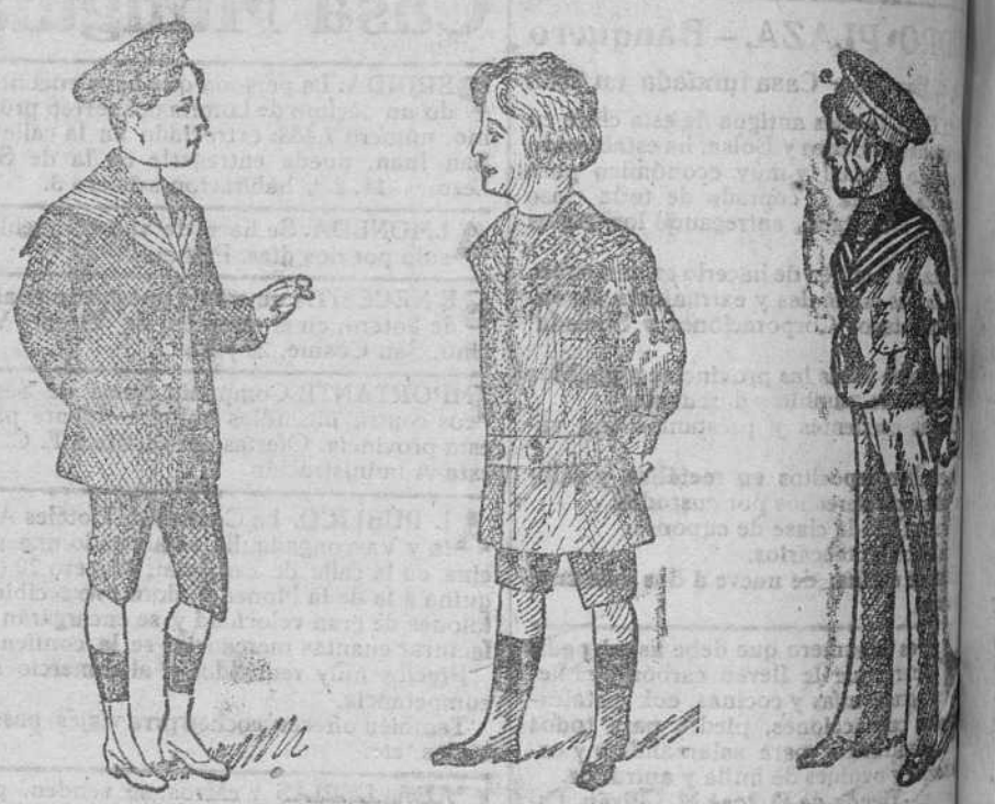
Sesenta modelos diferentes en trajecitos de dril, paño y pana, desde 8 á 50 pesetas