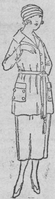
Vestidos de levita y falda, en lana, á 45, 50, 60, 70 y 80 pts.