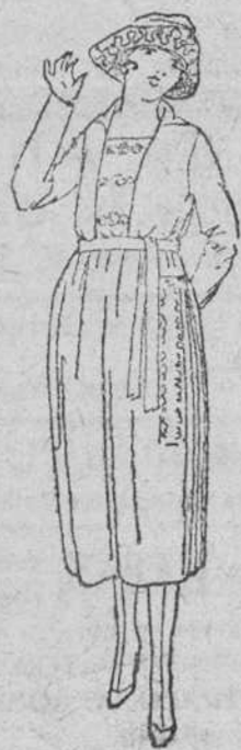
Vestidos enteros, en lana y color, á 35, 40, 45, 50 y 55 pts.