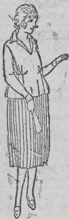
Blanda punto seda á 35, 40 y 50 pts. Faldas plisadas á 30, 35 y 40 pts.

En esta sección de señoras y niñas, encontrarán siempre los últimos modelos en vestidos enteros y de levita, en todos los colores, clases y estilos.