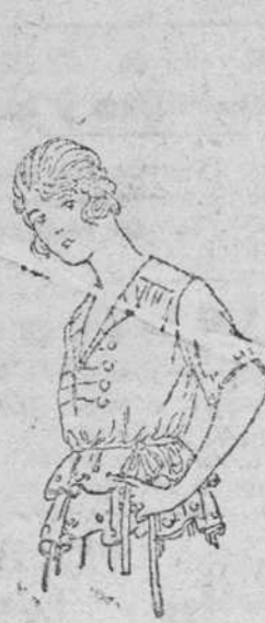
Blusas de punto, en diversidad de colores, 14, 15, 16, 20 y 25 pts