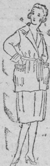
Trajecitos para jóvenes, en algodón, á 30 y 35 pts.