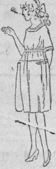
Vestidos para niñas en lana, á 14, 16, 18, 20, 25 pts. Modelos novedad