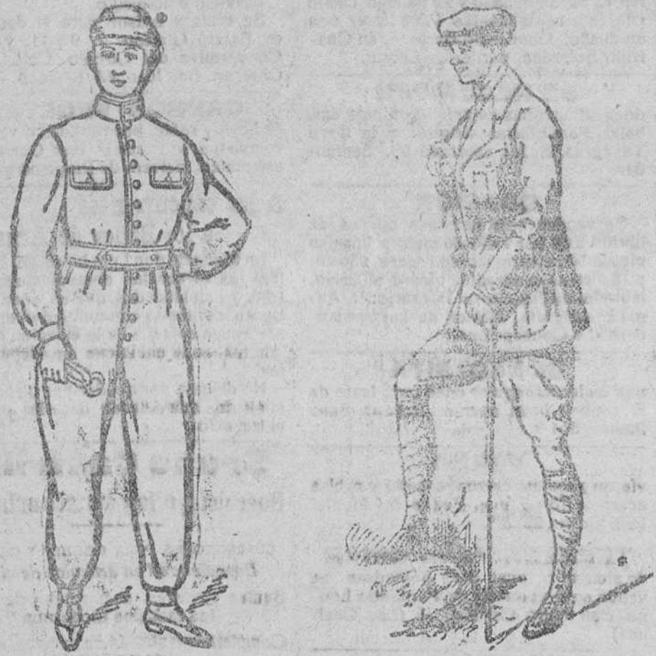
Enterizos azules y drill kaki á 15, 16, 18, 20 y 25 pts.

Gran bazar de ropas confeccionadas de caballero, señora y niñas.