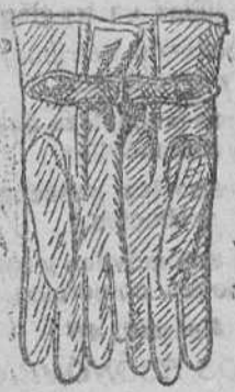
Gautes de piel, forrados de lana, á 7, 9 y 10 pts.