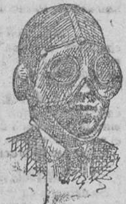
Pacamoniños de tana á 4 pts. Gafas á 4, 5 y 6 pts. s