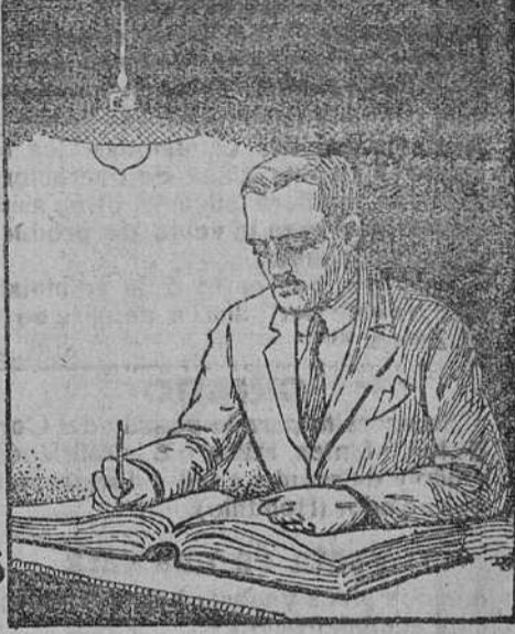
TRABAJANDO con "PHILIPS ARGA" LLENA DE GAS ARGÓN

Es inútil ocultar la verdad. Las modernas lámparas PHILIPS-ARGA sustituirán en breve plazo las de filamento metálico, que ya no convienen.