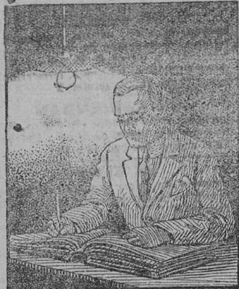
TRABAJANDO CON LÁMPARA DE FILAMENTO METÁLICO