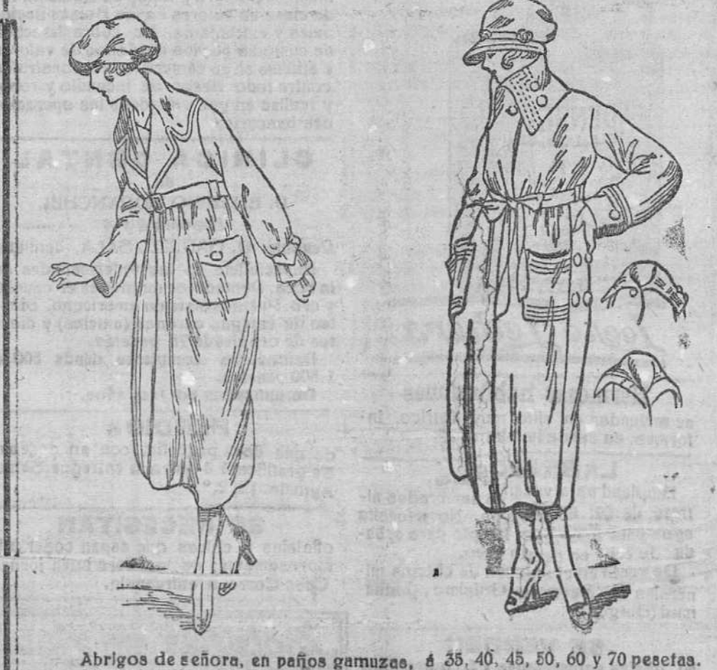
Abrigos de señora, en paños gamuzas, á 35, 40, 45, 50, 60 y 70 pesetas. Abriguitos de niñas á 10, 12, 15, 18, 20 y 25 pesetas.

Plaza Mayor, 42; y Lain-Calvo, 9.-Teléfono núm. 88.-Burgos Primera casa en confecciones de caballero, señora, niños y niñas Gran ocasión, como fin de temporada, en abrigos de señora y niñas.