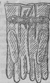
Guanies de piel, forrados de lana, á 7, 9 y 10 pts.