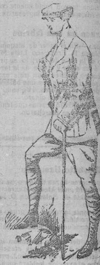
Trajes sport, en paño y pana, á 60, 70, 80, 90 y 100 pts.