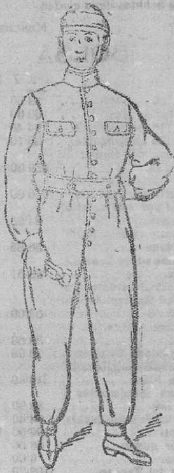
Enterizos azules y drill kaki á 15, 16, 18, 20 y 25 pts.

Primera casa en confecciones de esbalaro, señora, niños y niñas