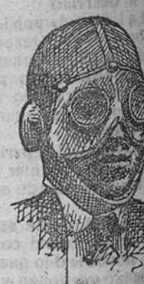
Passmonañas de lana á 4 pts. Gafas á 4, 5 y 6 pts.