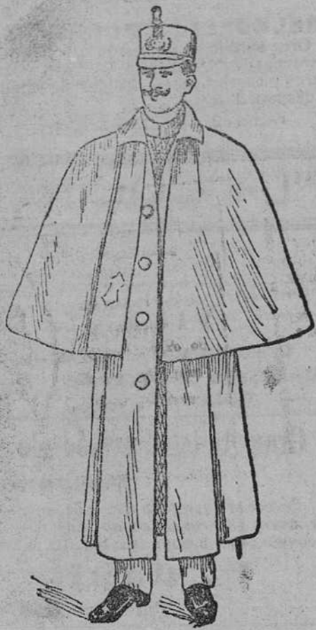
Impermeables militares, con esclavín, a 120, 130, 140, y 150 pesetas; sin esclavín, a 75, 80, 90 y 100 pesetas.