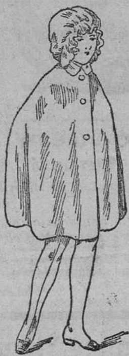
Abrigos impermeables para niños y niñas, desde 9 a 25 pesetas.