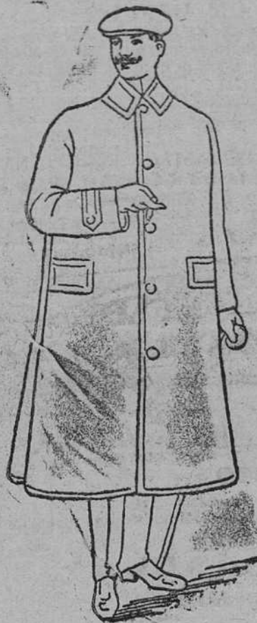
Impermeables ingleses y alemanes a 45, 50, 60, 70, 80, 90, 110, 120 y 125 pesetas.

Primera casa en confecciones de caballero, señora, niños y niñas