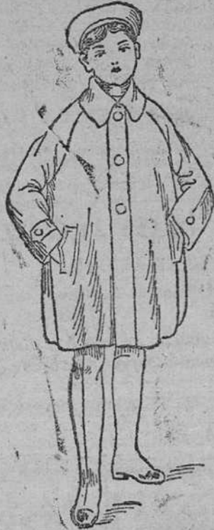
Abrigos impermeables para niños, desde 25 a 50 pesetas.