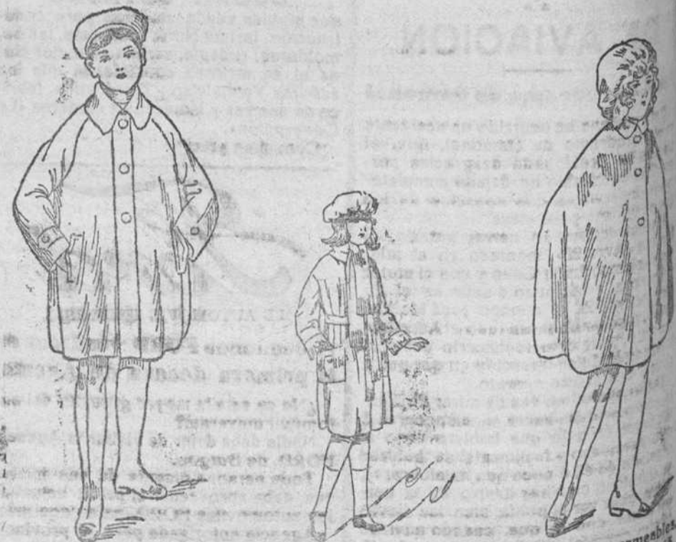
Abriguitos impermeables, de niños, á 22, 25, 30 y 35 pesetas. Abrigos de paño, para niñas, á 12, 15, 18 y 20 pesetas. Capitas impermeables de niñas desde 12, 15, 18, 20 y 25 pesetas