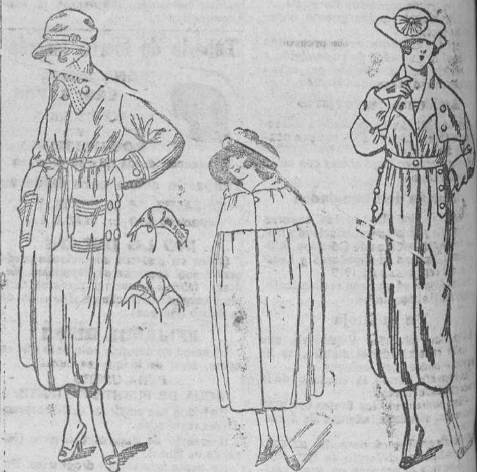
Grandes novedades en abrigos de paño, desde 30 á 175 pesetas. Capas novedad, desde 60 á 130 pesetas

Gran bazar de ropas confeccionadas de caballero, señora y niñas