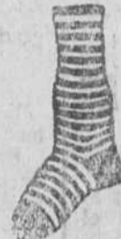
Calcetines finos, listas, novedad, á 1'25 y 1'50