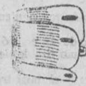
Paños piqué, á 1'50 y 1'75