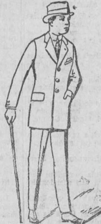
Trajes de paño melton, desde 70 á 150 pesetas.