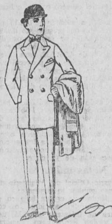
Trajes de paño, americana cruzada, de 50 á 60 pesetas.

Gran casa de tejidos, pañería y confecciones de caballero, señora y niños