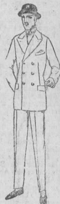
Trajes gabardina, confección esmerada, desde 35 á 60 pesetas