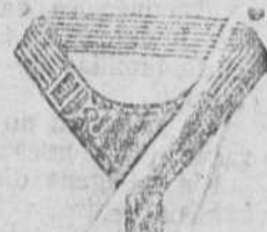
Liñas, á 0'50