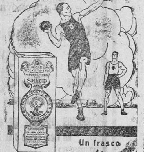
Un frasco de HIPOFOSFITOS SALUD

equivale a una semana de ejercicio al aire libre.