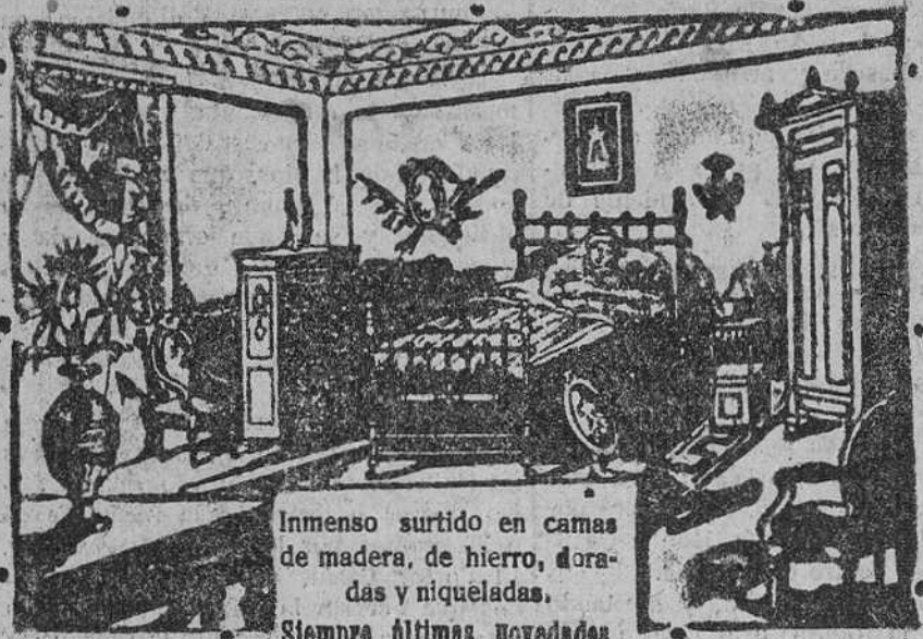
Vea el nuevo sistema, todo hierro, modelo patentado. Es muy limpio, fortísimo y muy económico.

Inmenso surtido en camas de madera, de hierro, doradas y niqueladas. Siempre últimas novedades.