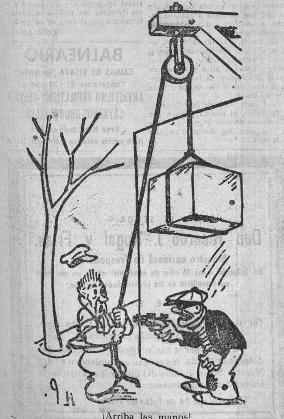
Arriba las manos!