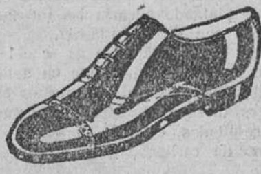
ZAPATOS Los mejores—Últimos modelos a 18 pesetas

La Casa que más surtido presenta y más barato vende