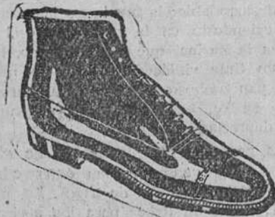
BOTAS Todo cosido a 19'50 pesetas