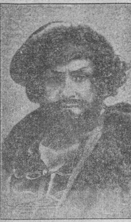
El notable baritono Basilio Zuckaroff...