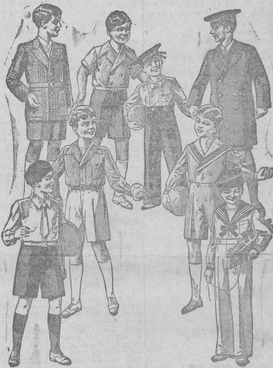
Trajecitos, modelos novedad, de 15, 18, 20, 25 y 30 pesetas

La Casa que más surtido presenta y más barato vende