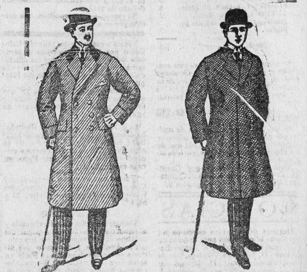
2.000 gabanes para caballero, a 40, 50, 60, 70, 90, 100 y 150 pesetas. Precio fijo verdad. Todos los artículos marcados.

Valleros de fundición y construcción de maquinaria Armentia, Mendi y Corres Barrio del Prado (Industrial Alavesa) TELEFONO 533 VITORIA