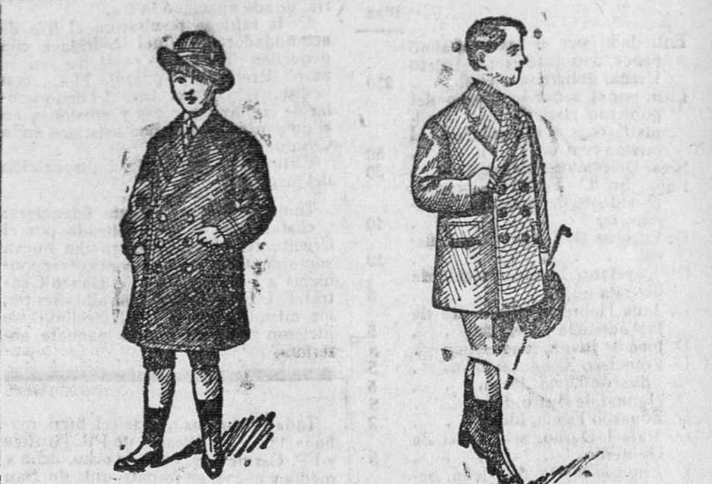
1.000 abrigos para niños, diversidad de modelos, a 16, 20 y 25 pesetas

Piano Mayor, 40, y Anís-Calvo, 9. Teléfono número 88-Burgos