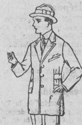
Americanas paño novedad / Rombo, a 45, 50 y 60 pts.